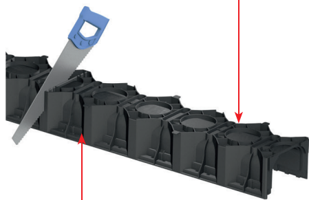
Ghidaj de tăiere pentru debitare la 0,5 m