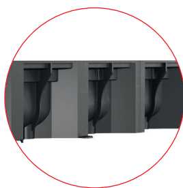
Pereți laterali rigizi cu structură hexagonală