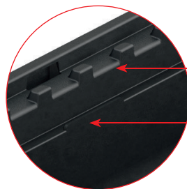
Sistem de blocare și de susținere a grătarului împotriva deplasării acestuia în plan orizontal și vertical. Asigură distribuția uniformă a sarcinilor