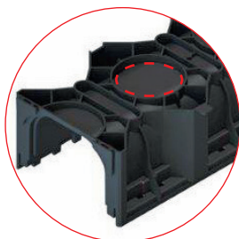
Pe un metru sunt posibile 8 puncte de descărcare (amprente Ø 50mm).