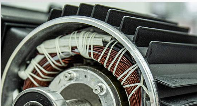
Carcasa motorului din aliaj de aluminiu