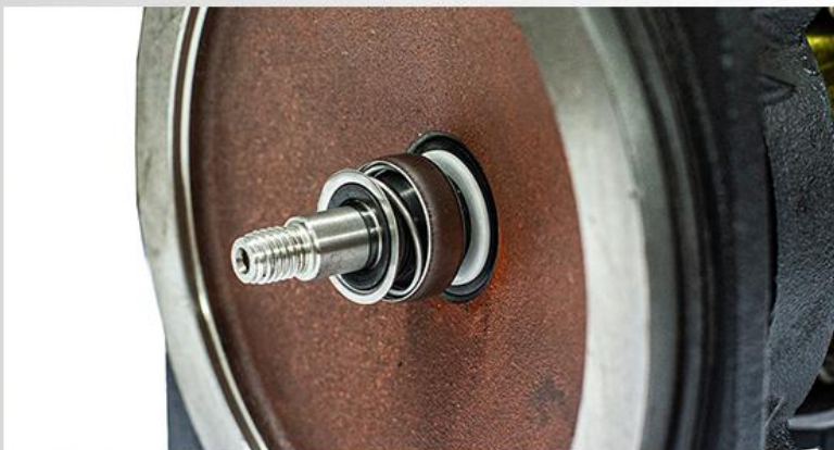
Garnitura mecanică: ceramică/grafit/NBR