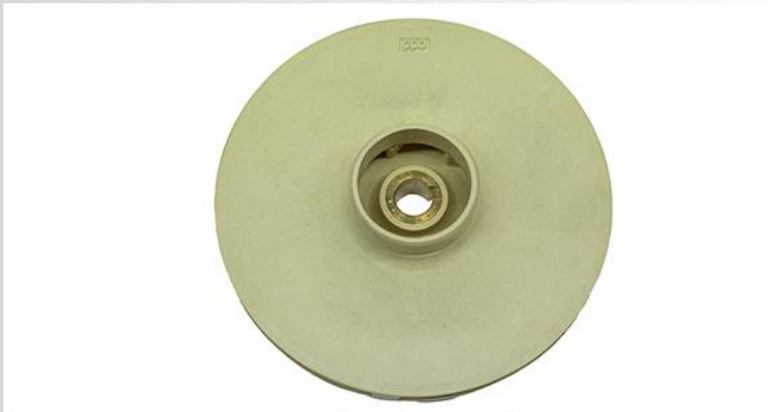
Turbina din PPO(techno-polymer)