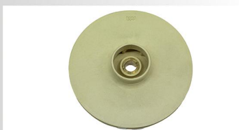
Turbina din PPO(techno-polymer)