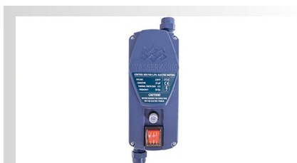
Panou comanda pompa