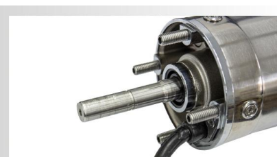
Ax pompa din inox