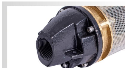
Corp de refulare din fonta